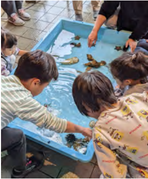
タッチングプール