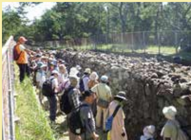
元寇防塁を見学中

大正時代の写真では、砂浜に防塁があるのがわかります。意外ですが、松林に囲まれたのは、その後のことなのです。今では、海辺の美しい自然に触れながら、防塁も学べる散策路が整備されているので、ゆっくり過ごしてほしいですね。